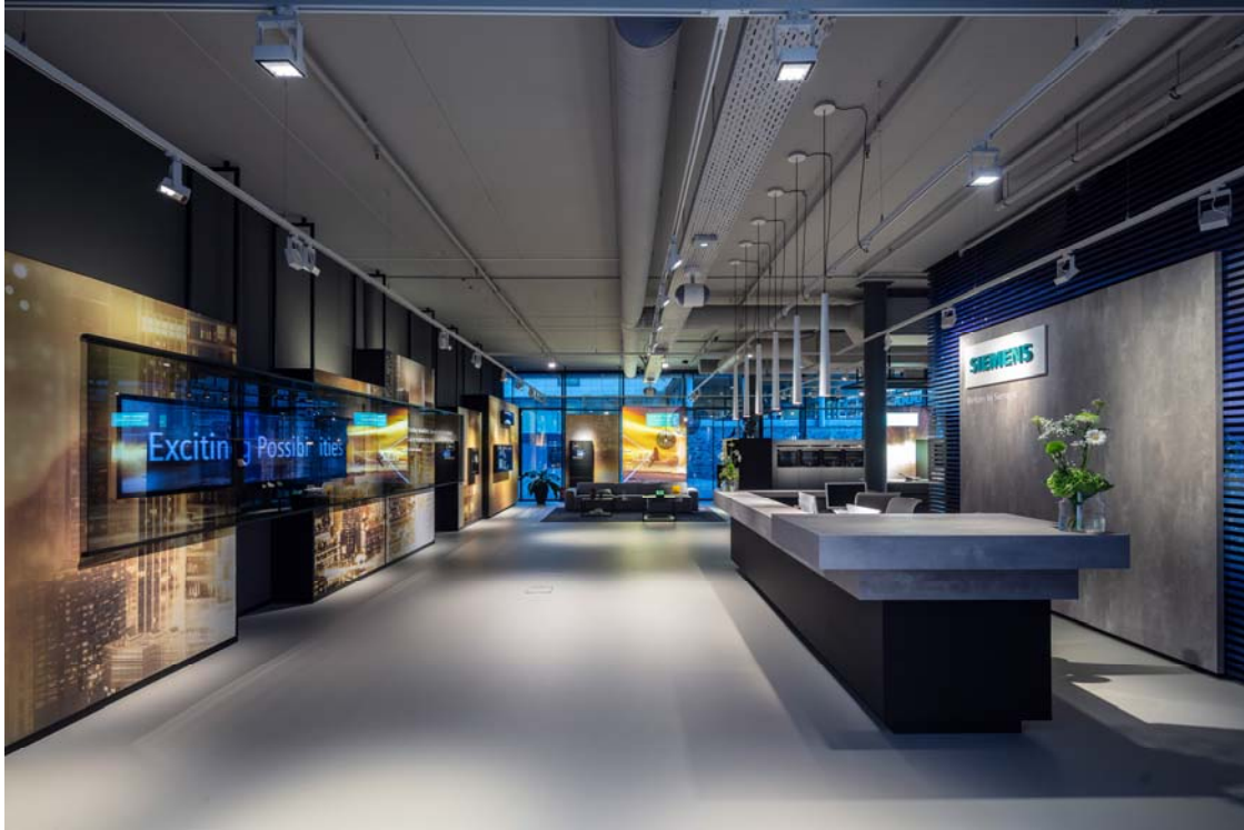
Siemens Showroom Amsterdam 2018