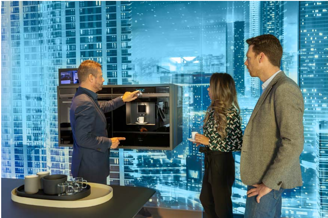
Siemens Showroom Amsterdam 2018

Schmidhuber Brand Experience GmbH Nederlinger Straße 21 80638 Munich Germany T +49 89 1579970 F +49 89 15799799 info@schmidhuber.de www.schmidhuber.de