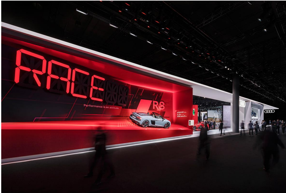
Audi auf der IAA 2019