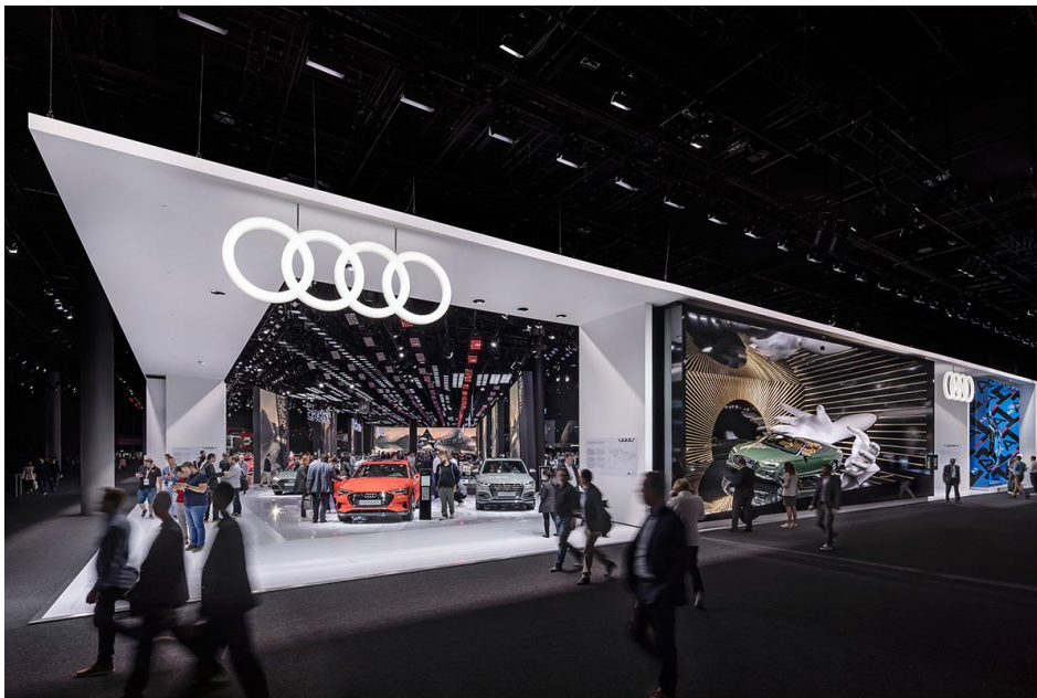
Audi auf der IAA 2019

Auftraggeber: AUDI AG, Ingolstadt Konzept und Architektur: SCHMIDHUBER, München Konzept und Kommunikation: MUTABOR, Hamburg Filmdokumentation: Dojo Filmhouse, München