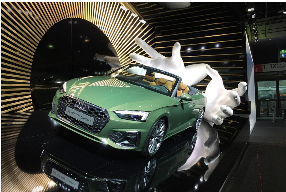
Audi auf der IAA 2019