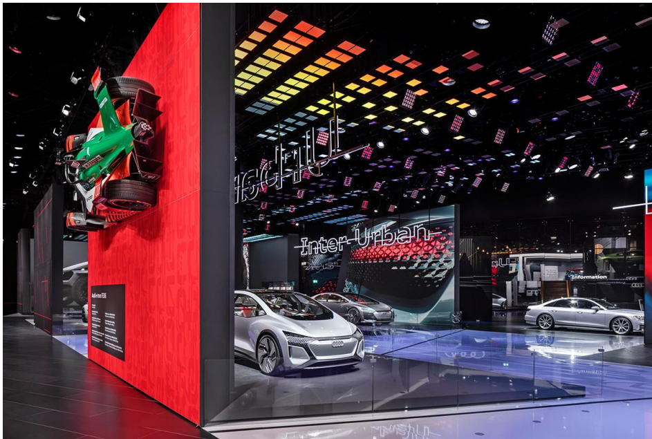
Audi auf der IAA 2019